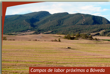
Campos de labor próximos a Bóveda