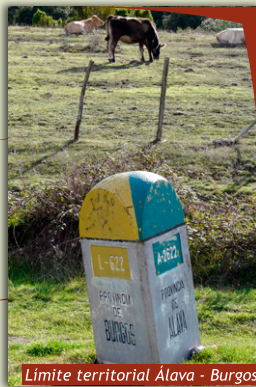
Limite territorial Álava - Burgos